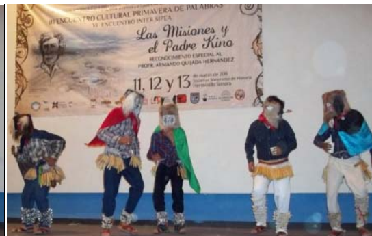
Danza De los Fariseos o Chapayecas (Festividad religiosa Semana Santa)