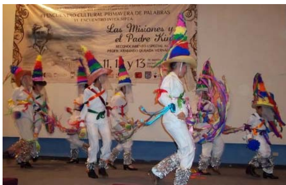
Danza de Los Matachines de Mátape, Etnia de los Ópatas.