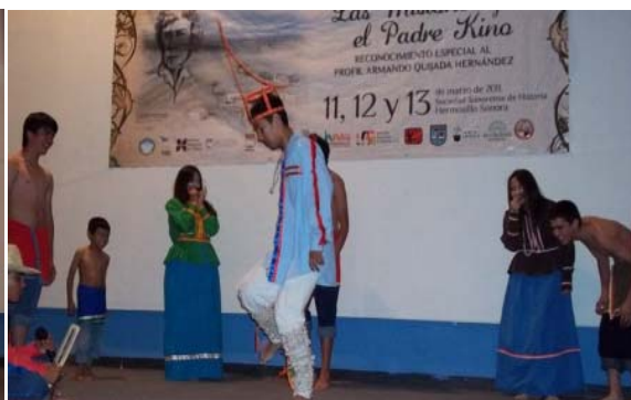
Baile o festividad de la Pubertad, Etnia de los Seris.