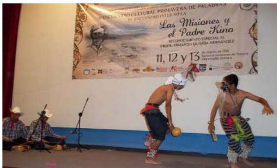
Danza del Venado, Etnia de los Yaquis